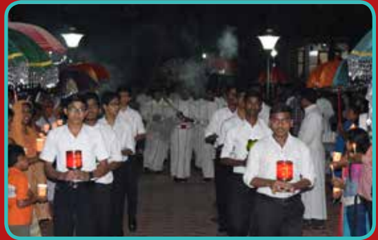
10 Day's Rosary Conclusion