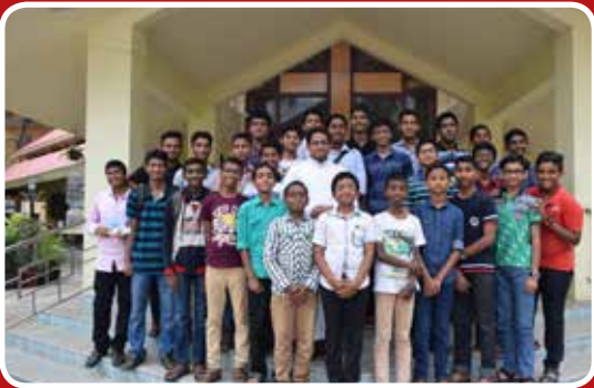
Altar Boy's Training