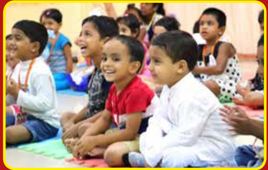
Childrens day at Kidzee Angels Nest