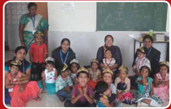
Childrens day at Christ Nagar Public School